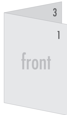
Tak wygląda ulotka złożona na pół w V